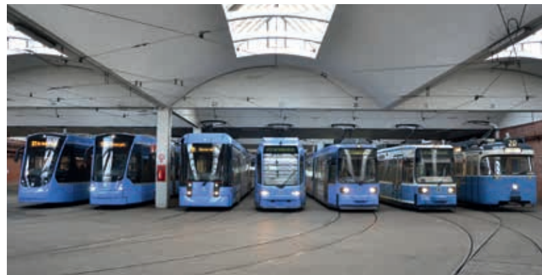
Von links: Avenio T 4.7, Avenio T 1.6, Variobahn S 1, R 3, R 2 (modernisierte Variante), R 2 und P (nicht mehr im regulären Einsatz)