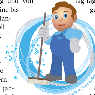
Grafik: © Lydiana Rossmann

hören auch Stationen, an die man erstmal gar nicht denkt – so vor allem zum Italiener-Wochenende die Bahnhöfe Messestadt Ost und Messestadt West wegen der dortigen Campingplätze. Aus diesem Grund braucht auch die Station Thalkirchen von Freitag bis Sonntag täglich eine Nassreinigung. Viele Fahrgäste hinterlassen viele Spuren.