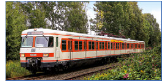
Zur Lange Nacht der Münchner Museen gibt es Nostalgie pur: Steigen Sie ein in den Museumszug aus dem Jahr 1969 mit der Wagennummer 420-001.

Die S-Bahn München ist beim Streetlife Festival (12./13. September) präsent: Am Stand der S-Bahn in der Nähe des Siegestores erwarten die Besu- cher ein Zugsimulator sowie Verlosungen, eine Fuß- ball-Speedbox (Torwandschießen mit Geschwindig- keitsmessung), ein Bobbytrain-Parcours für die Kleinen und weitere attraktive Angebote. Am Abend sorgt ein DJ für chillige Unterhaltung.