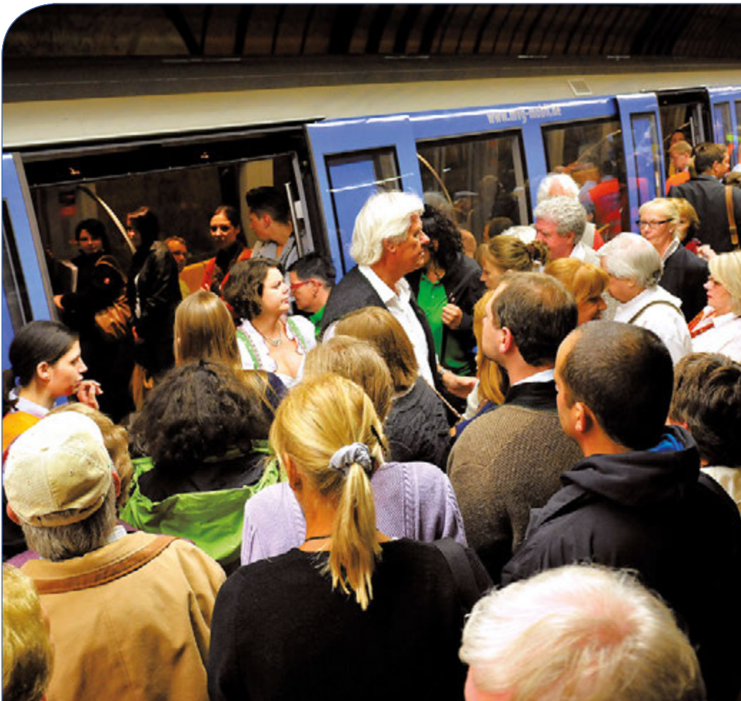
Zum Oktoberfest wird der U-Bahnhof Theresienwiese jede Nacht nass gereinigt, denn viele Fahrgäste hinterlassen nun mal viele Spuren. Eine extra Reinigungskraft ist an der Station vor Ort, um Schmutz so schnell wie möglich entfernen zu können.