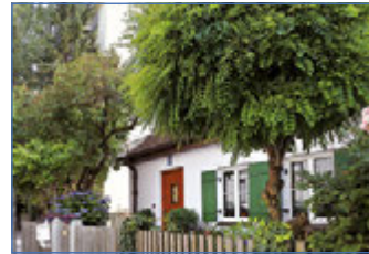
Rings um die Oefelestraße haben sich im ehemaligen Arbeiterviertel nette Läden und Cafés angesiedelt.