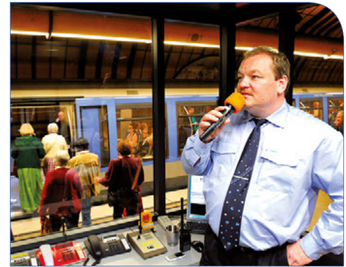
Zwei Wochen lang herrscht Ausnahmezustand zur Wiesn – auch bei den Mitarbeitern der MVG, die u. a. im U-Bahnhof Theresienwiese arbeiten. Als kleines Dankeschön für ihre Arbeit bekommen sie von den Fahrgästen manchmal Rosen oder Lebkuchenherzen.