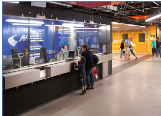
Im Zwischengeschoss Marienplatz stehen die MVG Mitarbeiter am Ticket- und Informationsschalter für Fragen bereit. Am 26. Oktober gibt es ein Fest zum Ende des Umbaus.

Übrigens: Das dichte Vertriebsnetz der MVG umfasst neben den drei MVG Kundencentern auch fünf MVG Infopoints sowie mehr als 150 private Verkaufsstellen und rund 1.400 Ticket-Automaten.